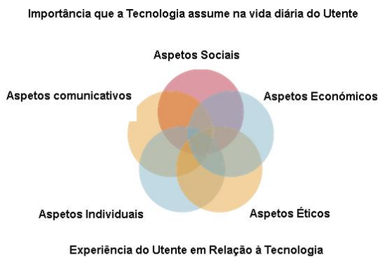
Figura 3- Aspectos a explorar na análise do utente na ATS

Lee e VêS Sinding (2007) sugerem um modelo analítico para estruturar os relatórios de ATS, com m claro enfoque nos conhecimentos e na experiência dos utentes em relação à tecnologia, os recursos do próprio utente e a importância que a tecnologia assume na vida diária do utente (Figura 3).